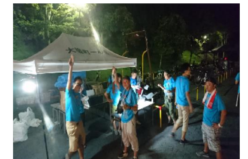
皆で、楽しみながら 活動しています。