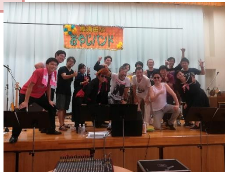
おやじバンドのみなさん、先生方、ありがとうございました！

子どもたちが楽しみにしているわくわくフェスティバルに向けて、ご尽力いただいた保護者の皆様や先生方に心よりお礼申し上げます。