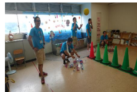
わくわくフェスティバル・ボーリングブース

7月はわくわくフェスティバルにて、ボーリング、スルーパス、スライム博士と参加した子どもたちに楽しんでもらえる様に、お手伝いさせていただきました。