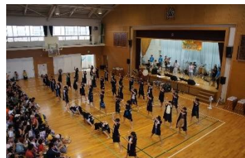
6年生のソーラン節 盛り上がりました♪