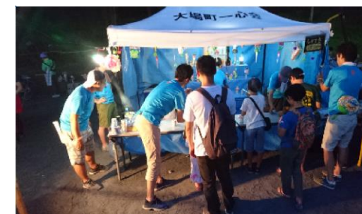
かやのき公園盆踊り大会 射的ブース大盛況

9月は黒須田自治会の御嶽神社のお神輿、小学校の草取り作業と活動が続きます。盛り上げて参りますので、よろしくお願いいたします。