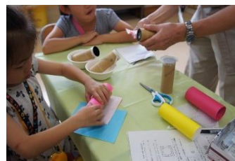
なるほどランド レンズカメラで不思議を体験