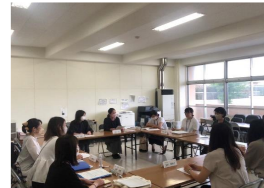
クラス委員定例会の様子→

給食試食会は4年ぶりの再開となります。参加については日を改めてご案内いたします。