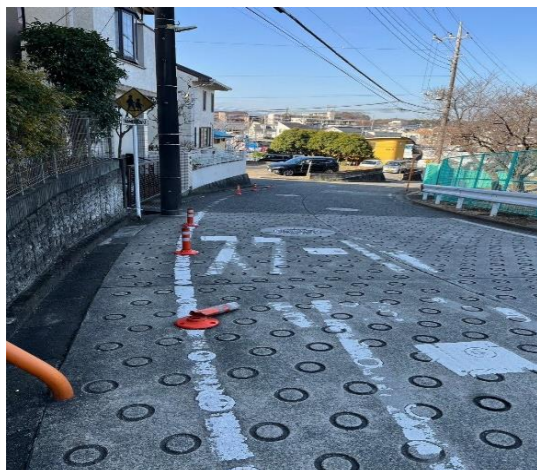
←大場町702付近の坂道 ラバーポールの破損や路面表示の薄れがあり、改善の要望を出しました

路面表示が消えかかっている道路や、見通しが悪くカーブミラーの設置が必要と思われる場所など、今年度は全8箇所を要望書に取りまとめ、関係各所に送付しました。